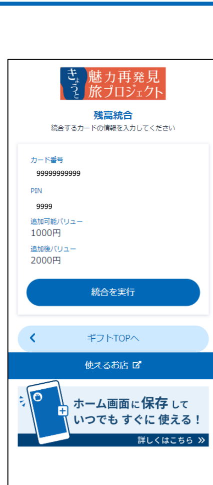
残高統合確認画面

※QRコードが複数ある場合（宿泊条件によって異なります）、全てのカード番号を合算することができます。